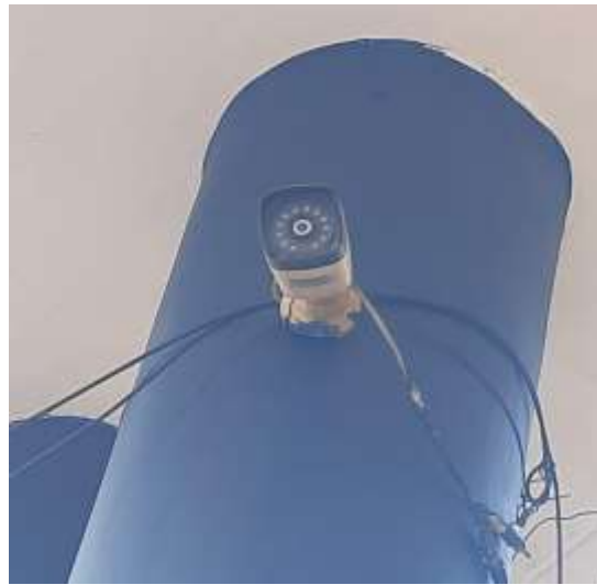
CCTV Display in LED in Principal Chamber